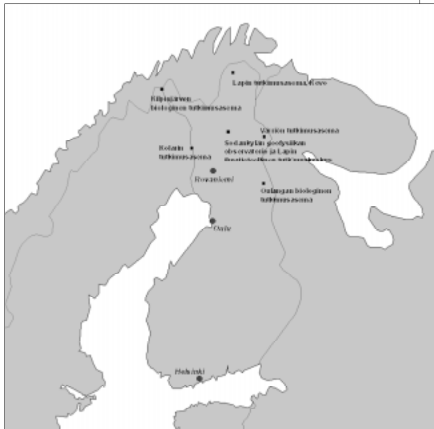
Kuva 4. LAPBIAT – verkosto.

Sodankylän observatorion johdolla käynnistyi vuoden 2001 lopulla LAPBIAT-hanke (Lapland Biosphere-Atmosphere Facility). LAPBIAT verkottaa pohjoisten tutkimusasemat koko eurooppalaisen ja kansainvälisen tutkijayhteisön käyttöön ja voimavaraksi. Eurooppalaiset tutkijat voivat tulla esim. Sodankylään UV-tutkimusta tekemään LAPBIAT-projektin puitteissa. Hankkeessa on mukana Sodankylän tutkimuslaitosten lisäksi Kilpisjärven, Kevon ja Oulangan biologiset asemat, Kolarin tutkimusasema ja Värriön aerologian mittausasema (kuva 4).