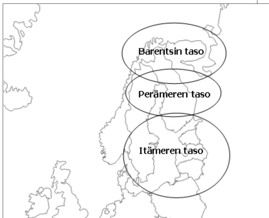
Kuva 6. Pohjoisen ulottuvuuden jäsentäminen.

S uomen pohjoisen ulottuvuuden toimintaa on viety eteenpäin kansallisilla foorumeilla. Foorumien perusteella voidaan sanoa, että pohjoisen ulottuvuuden toimintaa on mahdollista jäsentää edelleen alueellisesta näkökulmasta. Oheisessa kuvassa (kuva 6) on hahmoteltu eräs tapa jäsentää pohjoisen ulottuvuuden käsitettä kolmen alueellisen tason näkökulmasta. Koko EU:n pohjoisen ulottuvuuden toimintasuunnitelmaa ajatellen läpikäyvät teemat, jotka ovat yhteisiä kaikille kolmelle tasolle, ovat energia, logistiikka ja ympäristö. Näihin teemoihin liittyvällä tutkimuksella voidaan perustella myös eurooppalaista lisäarvoa. Pohjoissuomalaisesta näkökulmasta katsoen on syytä huomioida, ettei pohjoisen ulottuvuuden piiriin kuuluvaksi ja eurooppalaista lisäarvoa omaavaksi tutkimukseksi fokusoidu vain hankkeita, jotka edustavat 'Itämeren tason' hankkeita tai toisaalta arktisen tason eli kuvassa 'Barentsin tason' toimia.