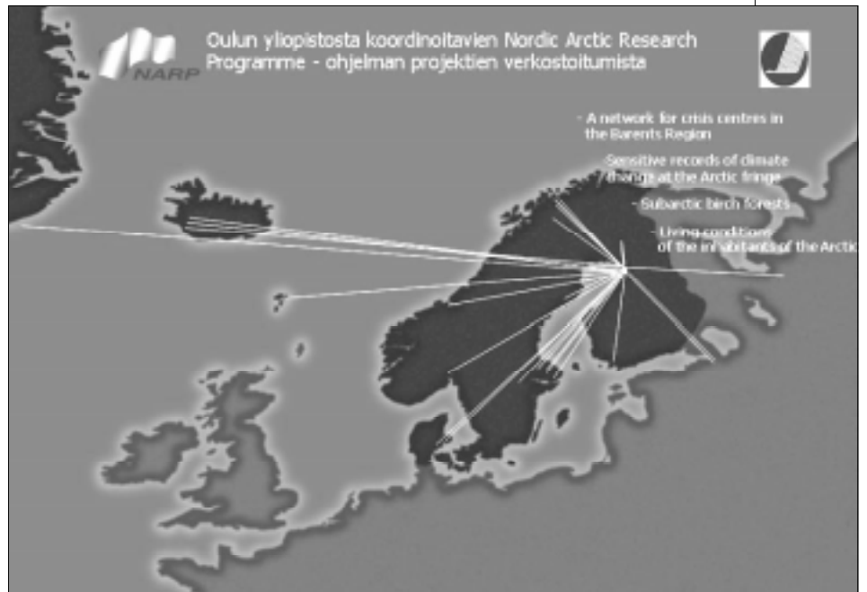
Kuva 5. NARP-ohjelman Oulun yliopistosta koordinoitavien projektien verkostoituminen.

Multipolisverkosto perustuu korkeatasoisen tutkimuksen ja koulutuksen ja huipputekniikan yritysten yhteistyölle. Oulun yliopiston alueelliset toimipisteet ovat olennainen osa multipolisverkoston toimintaa. Multipolistoimintamallin avulla edistetään yritysten kasvua ja kansainvälistymistä. Yhteistyötä Pohjois-Ruotsin polisten kanssa on tehty ja multipolisverkoston tavoitteena on laajentua myös Pohjois-Norjaan. Pitkällä tähtäyksellä verkon laajentamista koko Pohjois-Kalotin ja Barentsin alueelle pidetään tavoitteena. Yliopiston suhteet Pohjois-Ruotsin, Pohjois-Norjan ja Koillis-Venäjän yliopistoihin tukevat merkittäväällä tavalla multipolisverkoston vahvistumista.