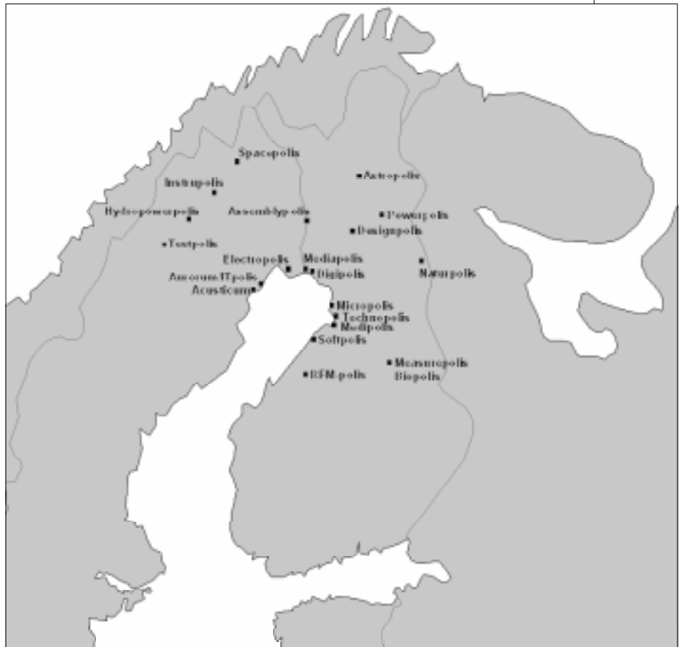
Kuva 3. Multipolisverkosto.

tutkimuksen avulla voidaan tukea Luoteis-Venäjän taloudellista kehitystä ja vakauttamista. Kaupan esteiden purkaminen edellyttää uusien toimintamallien kehittämistä ja samalla sijoitusaktiiviteettien kohottamiseen tarjoutuu paremmat mahdollisuudet.